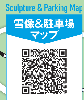
雪像&駐車場マップ